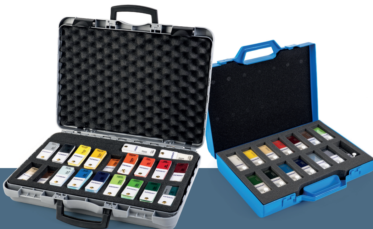
MALA G 2400 CORES