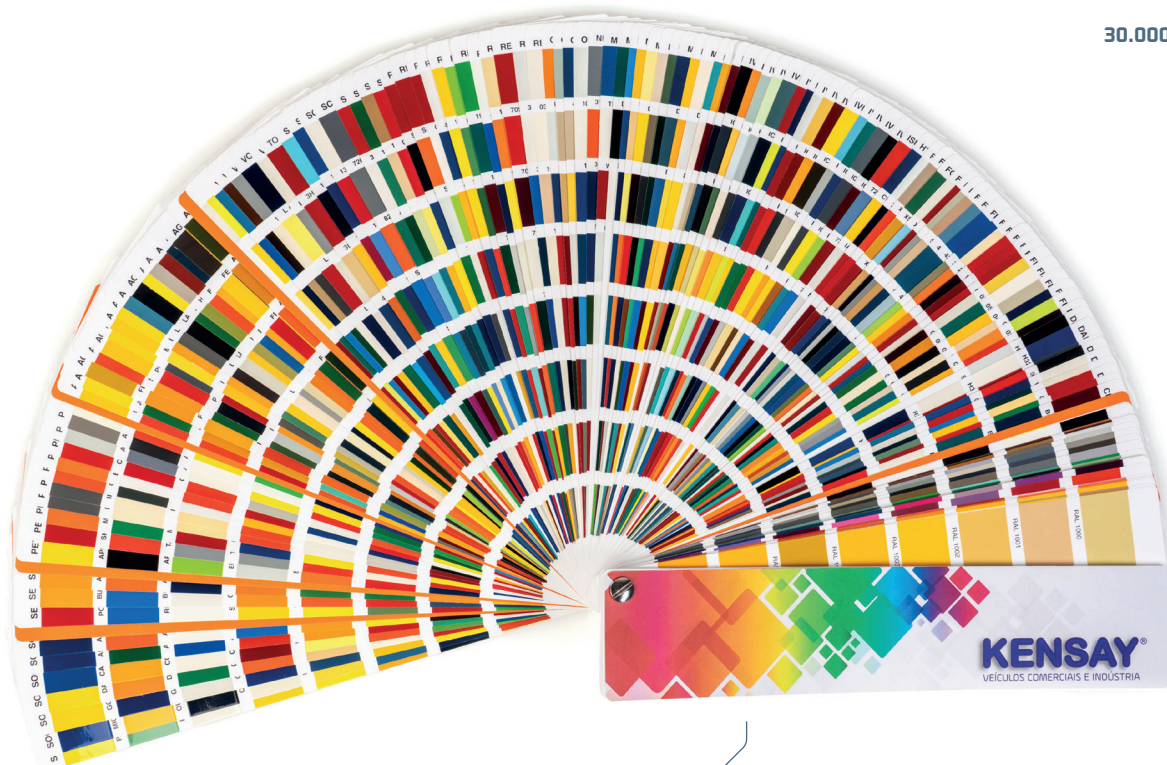
KENSAY 1260 CORES