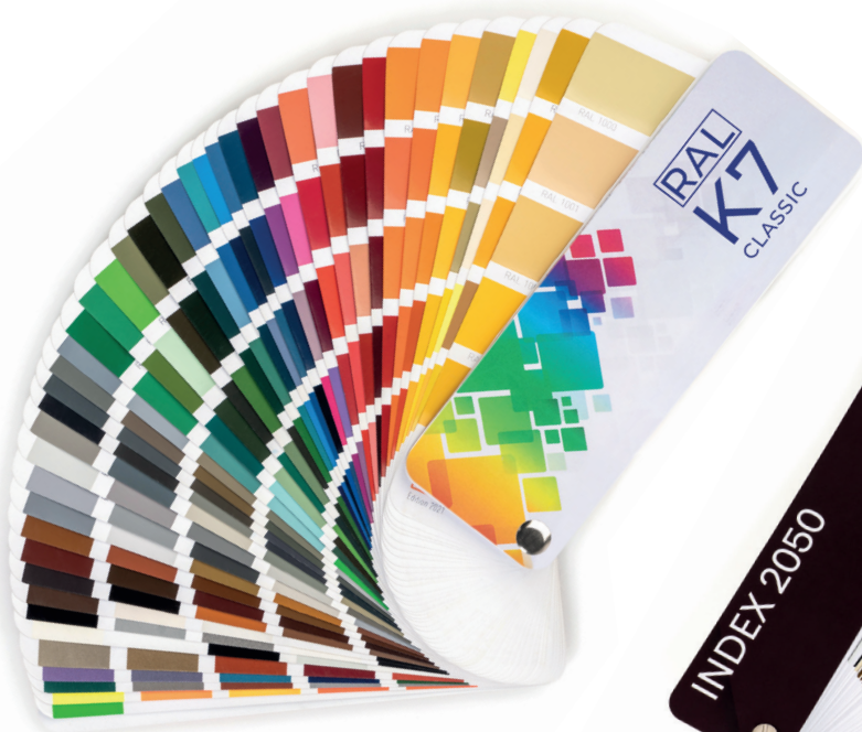
NCS 2050 CORES